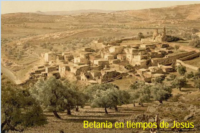
Betania en tiempos de Jesús